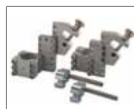
Dispositivo di aggancio