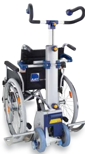
SDM7 supporto universale per carrozzine e passeggini

Per coloro che hanno bisogno di un aiuto solamente sulle scale e, il particolare, quando queste sono molto strette o a chiocciola, il montascale mod. s-max sella con seggiolino è la soluzione ottimale. La pedana è regolabile in altezza e ribaltabile all'indietro. In caso di trasporto o inutilizzo, il seggiolino può essere richiuso.