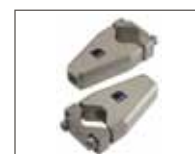
Supporti ruote estraibili