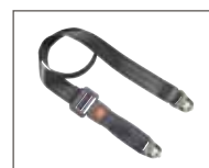
Cintura bacino con bloccaggio**