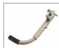
Leva per reclinazione