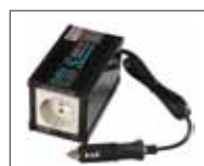
Invertitore di corrente