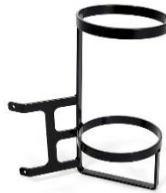
B83 Porta bombola ossigeno \varnothing 11.5 cm 1905890 \varnothing 13 cm 1905891 \varnothing 14.5 cm 1905892 \varnothing 15.5 cm 1905893