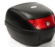
SE27 Bauletto 1908152