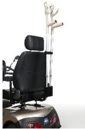
B31 Porta stampelle Plastica 1904125 Metallo 1906227