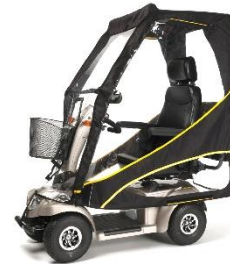
Scooterpac capottina Media 1912798