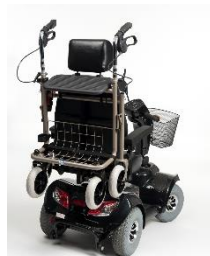
Porta deambulatore 1904796