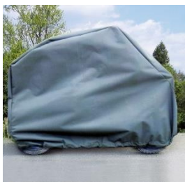
Copertura di protezione 1997570