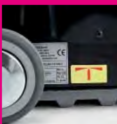
Punto di equilibrio: indica il punto entro il quale occorre arrestare la marcia ed inclinare il mezzo rispettivamente indietro o in avanti. Balance point: indicates the point at which the device must be stopped and tilted either backward or forward.