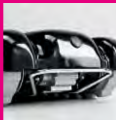
Maniglia anteriore per il sollevamento e/o trasporto manuale del montascale. Manual device for the machine's movement in case of breakdown.