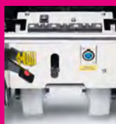
Comandi pannello inferiore • Pulsante di servizio per azionamento marcia. • Leva sicurezza blocco timone (solo N902). • Leva sgancio timone (solo N902). • Connettore di ricarica. Lower control panel: • Forward / Reverse switch. • Tiller safety lock (Only N902). • Tiller detachment lever (Only N902). • Charge connector.