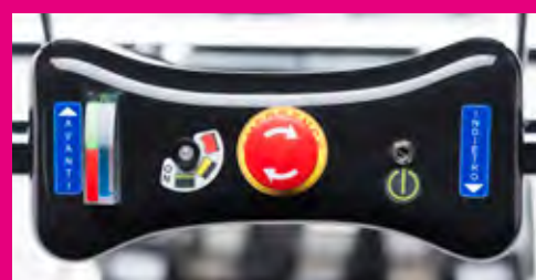
Comandi sul manubrio: • Pulsante marcia avanti. • Pulsante marcia indietro. • Pulsante di emergenza. • Indicatore di pendenza. • Jack di accensione. Control buttons on the tiller: • Forward button. • Reverse button. • Emergency button. • Inclination indicator. • Switching on Jack.