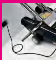
Caricabatteria interno (opzionalmente solo per N902): • Controllo elettronico della ricarica. • Indicatore di ricarica. • Protezione di polarità inversa e corto circuito. • Dispositivo controllo presenza cavo di alimentazione. Internal battery charger (Optionally only for N902): • Electronic recharge control. • Recharge indicator. • Reverse polarity and short circuit protection. • Power cable detection device.