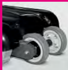
Ruote trazionate antiribaltamento (Solo N959 / N959R / N959TM). Rollover drive wheel (Only N959 / N959R / N959TM).