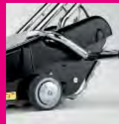
Ruote di manovra autobilanciate per un immediato utilizzo all'arrivo sul pianerottolo. Directional autoadjustable wheels for a prompt use at the arrival on the floor.