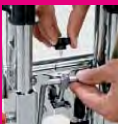
Manovella per la movimentazione manuale in caso di guasto, alloggiata direttamente sul timone (escluso N956 / N959 / N959R / N959TM). Crank side to manual handling in case of failure, directly on the tiller (except N956 / N959 / N959R / N959TM).