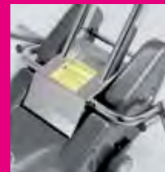
Braccetti richiudibili di appoggio ruota carrozzina (escluso N959 / N959R / N959TM). Folding lower support-arms for wheelchair (except N956 / N959 / N959R / N959TM).