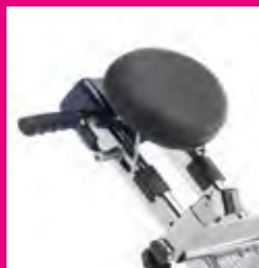
Poggiatesta regolabile. Adjustable headrest.